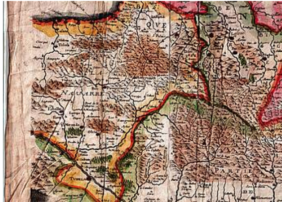
Konkistaren dema. 1512an konkistatu zuen Gaztelak Nafarroako Erresuma, baina 1642koa da mapa hau, eta bertan erresumak eutsi egiten die oraindik bere mugei. Frantziarrek egindakoa da, eta Espainiaren eta Frantziaren arteko mugak ageri ditu. Nafarroan kokatzen ditu mugarriak mapak, eta ikusten denez konkistaz geroztik mende bete baino gehiago pasa arren, frantziarrek oraindik ere aitortu egiten zuten Nafarroako Erresumaren lurraldetasuna. Betiere, beren orbitaren barnean. / 'MAPAS PARA UN NACION.' / --